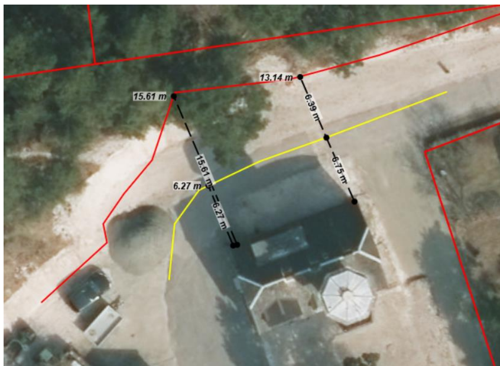
Foto 3: Luftfoto 2018. Afstand fra hus til gammel skræntkant (gul) og afstand fra hus til nuværende skræntkant (rød). Det ses, at der er fjernet hhv. 15,61 meter af skrænten (venstre side) og 6,39 meter (højre side).