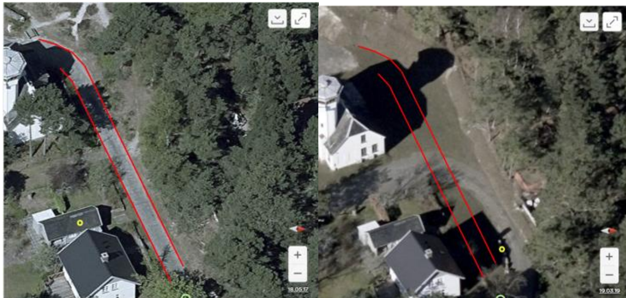
Foto 1 (venstre): Foto fra 2017 med markering af Fyrvejen. Det ses, at det naturlige terræn med klit starter lige til højre for vejen.

Friluftsrådet er den 9. marts 2020 blevet oplyst om, at Kystdirektoratet den 28. maj 2019 har besigtiget området, hvor det vurderes, at "der er sket reetablering af terræn i rimeligt omfang" (se bilag 3). Rådet stiller sig undrende og uenig overfor vurderingen, da de fjernede 6-15 meter klit fortsat ikke er reetableret (se foto 1-3).