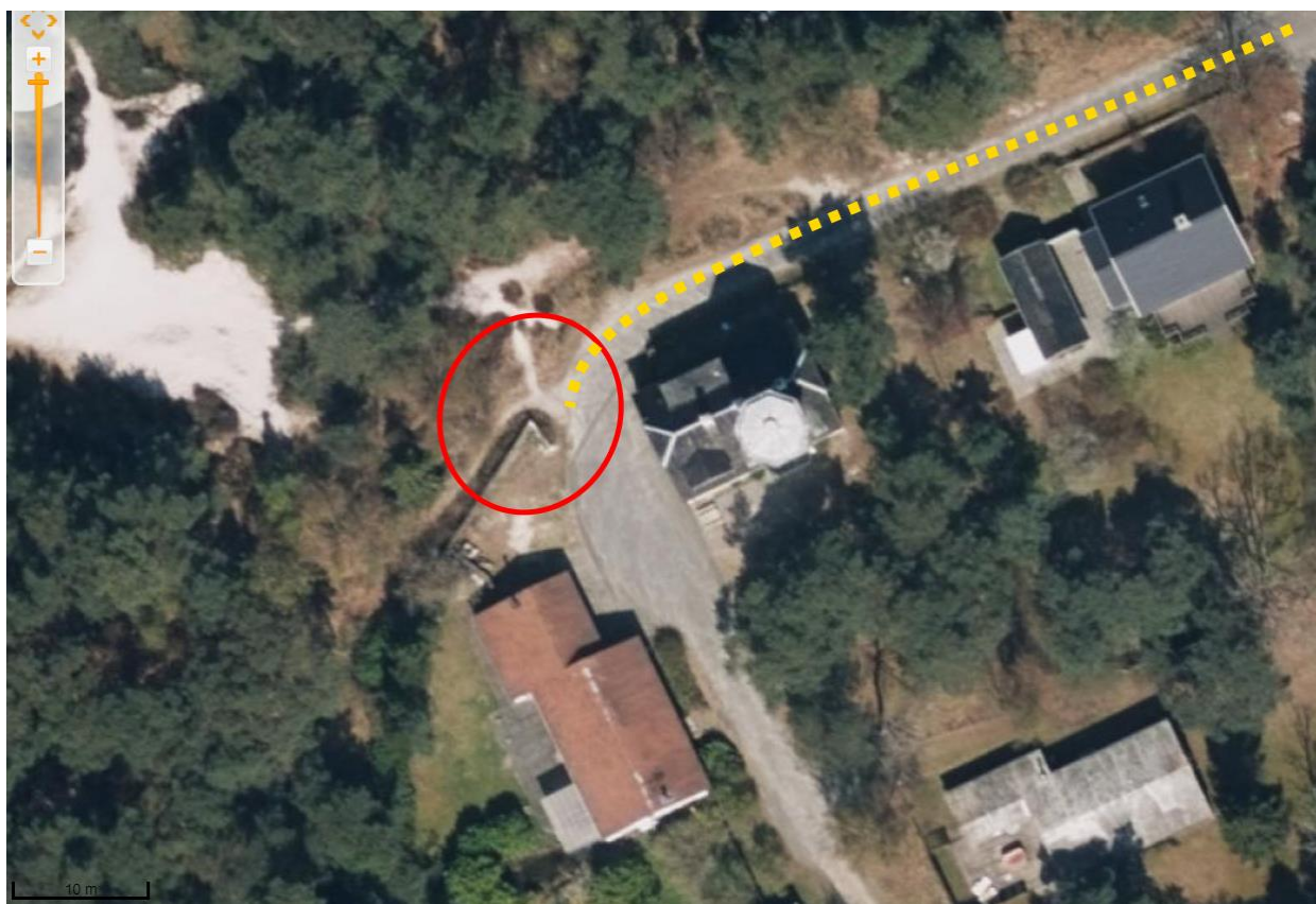
Foto 4: Foto fra 2017 der viser den originale Fyrvejen (gul stiblet linje), der giver adgang til udspringet af redningsvejen (rød cirkel).

I den nordvestlige del af matriklen udspringer den gamle redningssti/redningsvej 1 , som har høj kulturhistorisk og rekreativ værdi, og været benyttet af blandt andet offentligheden siden sidst i 1900-tallet. Den originale Fyrvejen gav adgang til denne sti, men med flytningen af Fyrvejen er det ikke længere muligt for offentligheden at benytte sig af den værdifulde sti (foto 4 og 5). Bornholms Regionskommune har anmeldt sagen til politiet og sagen er ikke afgjort endnu.