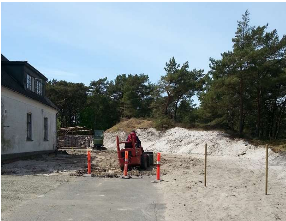
Efter-billede fra 18. maj 2018. Asfaltvej fjernes, i baggrunden ses rundbuehal under opførelse, hvor redningsstien gik.