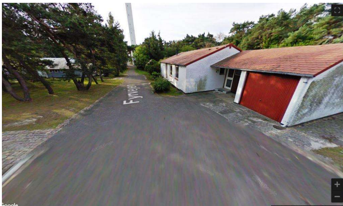
Billede fra Google Street View, hvor Fyrvejen inden terrænændringen gik mod syd til Dueodde Fyr.

Der er foretaget omfattende terrænreguleringer inden for strandbeskyttelseslinjen, der hvor Fyrvejen og redningsstien normalt ville gå. Ejer har således allerede inden den meddelte dispensation til at omlægge adgangsvejen foretaget betydelig afgravning for at fjerne den asfalterede Fyrvejen og adgangen til redningsstien. Ejer var ellers tydeligt gjort bekendt med den offentlige adgang, forud for købet af ejendommen. Offentligheden har lovlige passage ad Fyrvejen ud til fyret og lovlige passage ad en gamle redningssti, der fortsætter mod vest på nordsiden af Fyrvejen 11, der hvor Fyrvejen drejer mod syd, ud mod fyret.