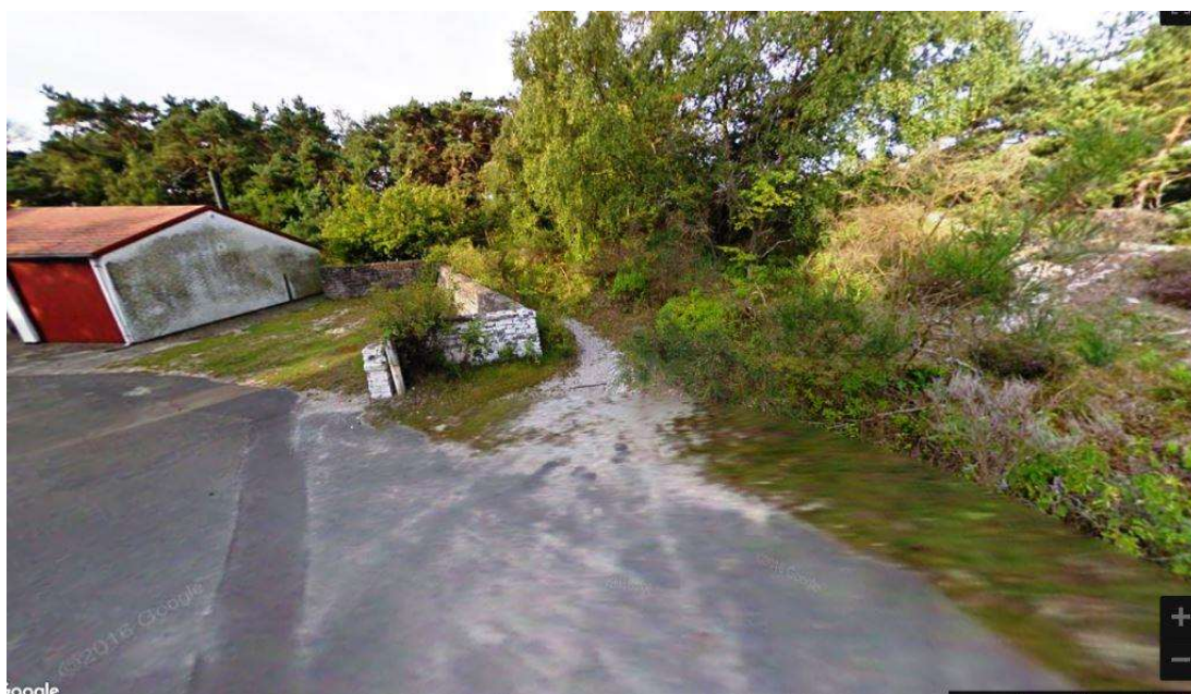
Før-billede fra Google Street View, hvor Fyrvejen møder redningsstien, der hvor den ulovlige rundbuehal nu er opført.

Der er foretaget omfattende terrænreguleringer inden for strandbeskyttelseslinjen, der hvor Fyrvejen og redningsstien normalt ville gå. Ejer har således allerede inden den meddelte dispensation til at omlægge adgangsvejen foretaget betydelig afgravning for at fjerne den asfalterede Fyrvejen og adgangen til redningsstien. Ejer var ellers tydeligt gjort bekendt med den offentlige adgang, forud for købet af ejendommen. Offentligheden har lovlige passage ad Fyrvejen ud til fyret og lovlige passage ad en gamle redningssti, der fortsætter mod vest på nordsiden af Fyrvejen 11, der hvor Fyrvejen drejer mod syd, ud mod fyret.