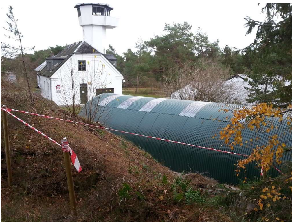
Efter-billede fra 18. november 2018. Kik mod sydøst over taget af den færdige rundbuehal anlagt på redningsstien. Privatfoto.

Friluftsrådet mener endvidere at Kystdirektoratet mangler en grundig redegørelse for og vurdering af, hvilken betydning terrænændringen som bl.a. den nye adgangsvej medfører, har for landskabet i området. Fyrvejen er en offentlig vej og stien er en gammel redningssti og har stor lokalhistorisk betydning for området.