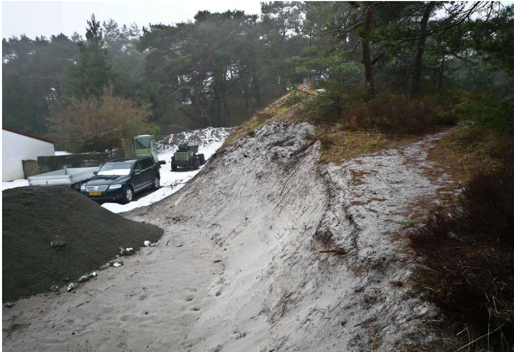
Efter-billede fra 18. april 2018, hvor der foretaget ulovlige terrænændringer.