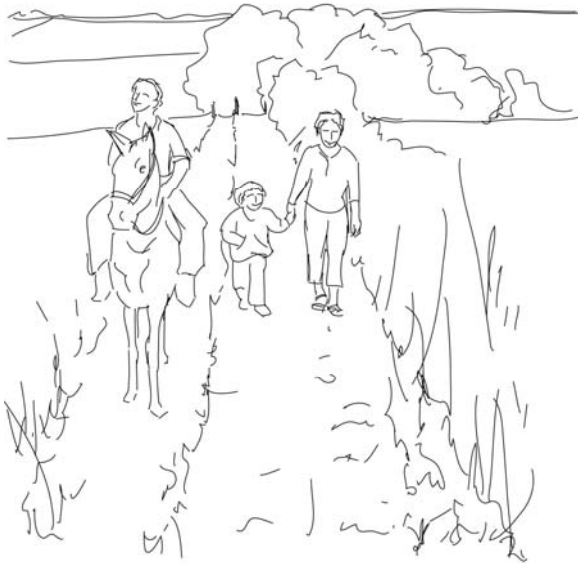
En multifunktionel sti til ridende og til gående