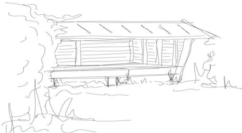
Shelter til primitiv overnatning og læ

Der er ikke meget skov i nærheden af Løkken. Nybæk Plantage, som er beliggende syd for Løkken by på kommunegrænsen til Jammerbugt Kommune, kan med god vilje betragtes som værende bynær til Løkken. Da der er mange interesser for benyttelse af denne plantage, bør der laves en partnerskabsaftale for udbygningen af denne skov.