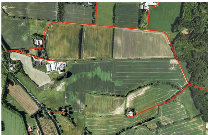
Fig 2. Samme udsnit som fig. 1 men fra 2010. Bemærk de få men store marker og en af gårdene er vokset på bekostning af de øvrige. En markvej fra gården ud til de øvrige marker er nedlagt og i stedet ses ny tydelige kørespor ca. 10 m inde på marken. Disse kørespor registreres ikke som mark- eller adgangsveje.

anvendelsen af flyfotos i modsætning til det oprindelige projekt, hvor der udelukkende blev anvendt topo-