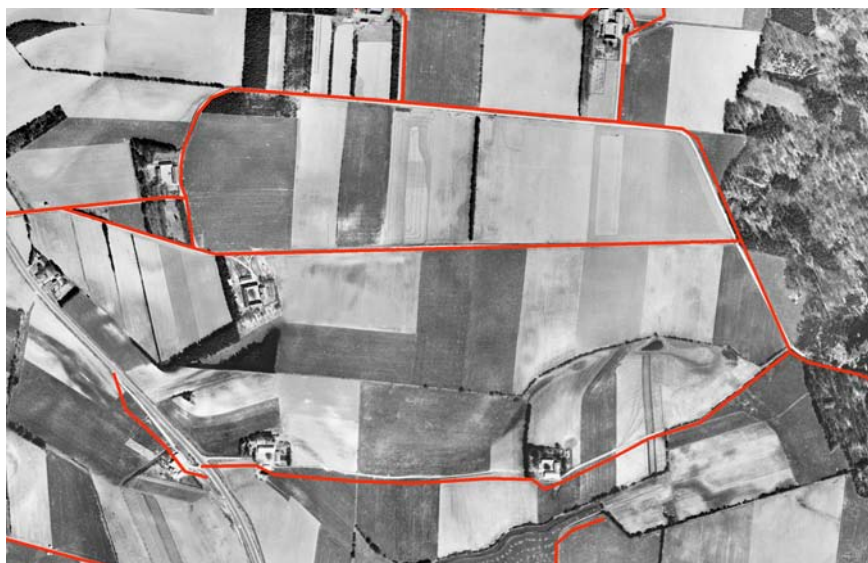
Fig. 1. Udsnit af 1954 flyfoto fra Gadbjerg. Bemærk det store antal marker og at gårdene nærmest er lige store. Markvejene er vist med rødt.

Undersøgelsen tager afsæt i de fire 5 km x 5 km områder, som blev kortlagt og offentliggjort i undersøgelsen fra 1999 i det tidligere Vejle Amt, men analysen er nu baseret på