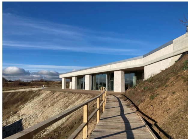
Stevns Klint Experience. Foto: Stevns Kommune, januar 2023.

Rødvig Kro på hjørnet er fra 1844 og i krohaven lå indtil 1971 en dansepavillon.