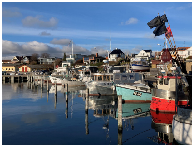
Rødvig havn. Foto: Stevns Kommune, januar 2023.

VÆLG DEN RUTE, DER PASSER DIG I FORHOLD TIL LÆNGDE ELLER INTERESSE-PUNKTER. DE FIRE FORSKELLIGE RUTER - GRØN, RØD, BLÅ OG SORT - ER FRA CIRKA 3 TIL 12 KM.