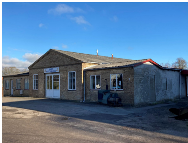
Rødvig Motorskibsmuseum. januar 2023.

På turen kommer du gennem Ll. Heddinge landsby, hvor stjerneudstyknngen af byens jorde i 1799, som blev foretaget i forbindelse med landboreformerne, stadig kan ses i landskabet.