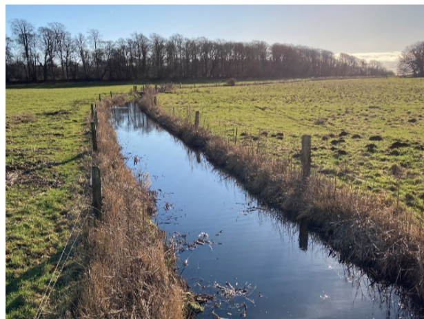
Havnelevrende. Foto: Stevns Kommune, januar 2023.

Turen fortsætter langs stranden til havnen med små fiskerskure, skibs- og bådebyggeri og vand-sportsklubber.