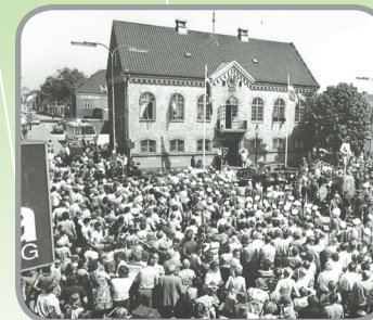
Kongefamilien ankommer til rådhuset ved Sallingsund broens indvielse i 1978

Mors er den største ø i Limfjorden, så der er meget fjord - denne kløver byder dog også - trods navnet - på gågade, spændende villakvarterer og åbne grønne områder. Dette kombineret med fjorden gør ruten særlig for dem, der gerne vil ud på en lidt længere tur.