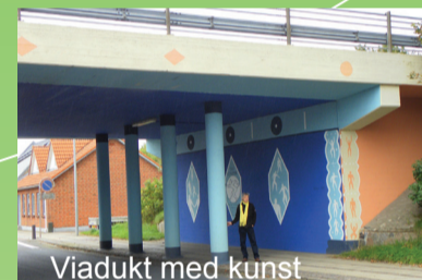
Viadukt med kunst