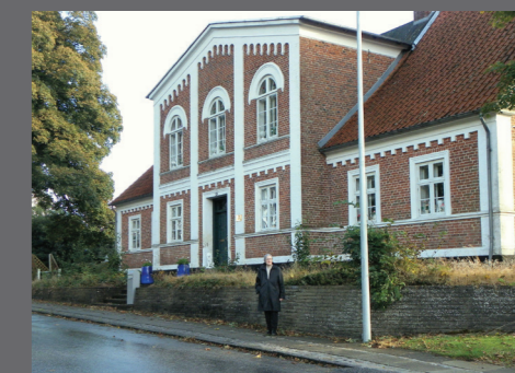
Tinghus og spjæld