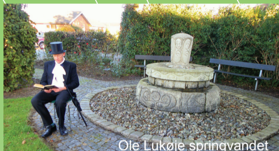
Ole Lukøje springvandet

Nummererede pæle for hver 500 m giver mange muligheder for at planlægge opgaver for børn og variere sin motionstur med faste intervaller.