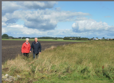
Marsboere på vandring