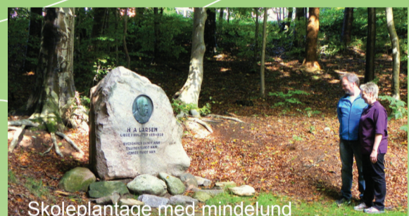
Skoleplantage med mindelund