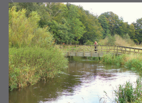
Udsigt over Holsted Å

Ruterne rummer oplevelser og aktiviteter til forskellige målgrupper. Nogle strækninger er kendte, mens andre kan opleves som nye og updagede.