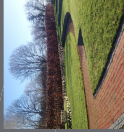
Udekirken i Ørslev