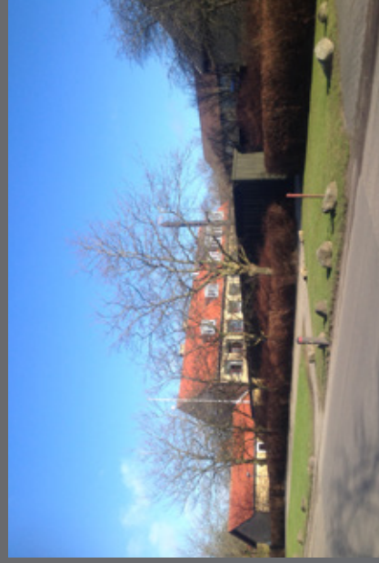
Skolen i Ørslev