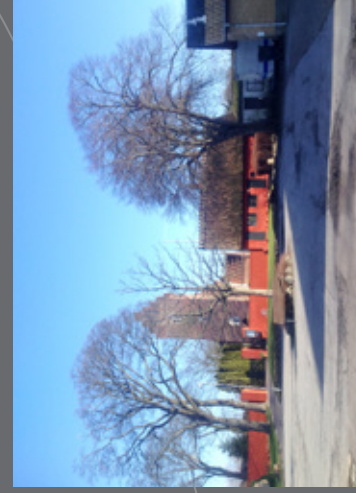
Kirkepladsen i Ørslev