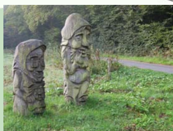
Træfigurer ved Skovlyst Naturskole