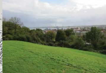
Udsigt fra Galgebakken