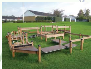
Motions- og legeredskaber ved Hørgården