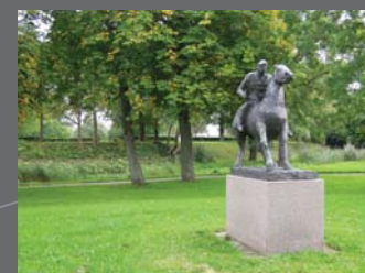
Ringridderen ved Brundlund Slot

Der kan indhentes elektroniske informationer med mobiltelefon og lignende ude på de enkelte ruter via de applikationer, der er opsat, og som fortsat vil blive udbygget i fremtiden.