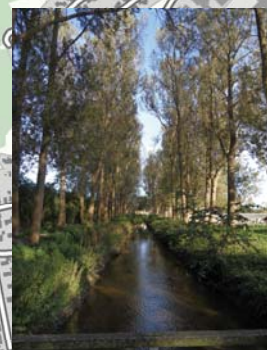
Poppelalé ved Slotsmølleåen