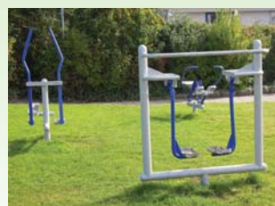
Motions- og legeredskaber ved Hørgaarden