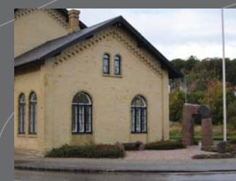
Banegården, Kunst & Kultur