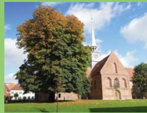
Sct. Nicolai Kirke