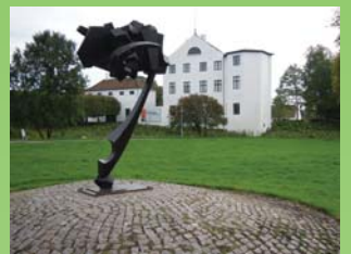
Brundlund Slot og skulpturen Vækst