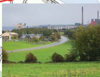
Udsigt fra den nye trampesti til Årup Skov