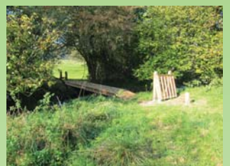
Trampesti til Årup Skov

I fjorden kan man måske få øje på en sæl, marsvin eller måske en hval. Turen går desuden forbi lystbådehavnen, den fine strandpromenade, hvor der er gode muligheder for badning, fiskeri og vandskisport. På Sønderstrand er der anlagt en sti med fast belægning og en handicapvenlig badebro.