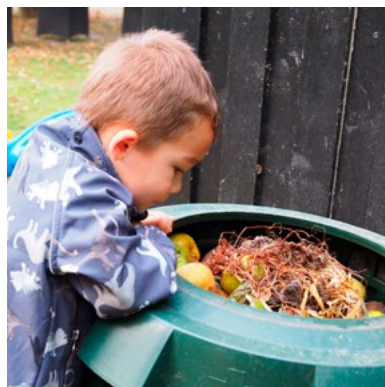
Grønne Spirers medlemsinstitutioner sætter tusindvis af grønne og bæredygtige tiltag i værk rundt om i hele landet.

Siden 2006 har Friluftsrådet gennem programmet Grønne Spirer uddelt Grønne Flag til børnehaver, vuggestuer og dagplejere, der viser at både børn og voksne er kommet tættere på naturen i deres hverdag. I 2022 kom der et nyt bæredygtighedsflag til. Og i 2023 har hele 64 børneinstitutioner i Danmark og en enkelt i Sydslesvig hejst bæredygtighedsflaget, der viser, at her arbejdes pædagogisk med biodiversitet og FN's Verdensmål for en bæredygtig udvikling. Det er en stigning på godt 16 procent på et år. I alt har 307 børneinstitutioner hejst et grønt flag i 2023. Godt 1.000 vuggestuer, børnehaver og dagplejegrupper er medlemmer af Grønne Spirer. Det er cirka 20 procent af landets børneinstitutioner. Grønne Spirer tilbyder ca. 40 årlige kurser og seminarer samt naturpædagogiske materialer til sine medlemmer.