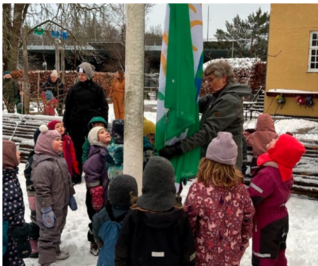
Børn fra Gladsaxe Skovbørnehave hejser Grønne Spirers Bæredygtighedsflag sammen med Gladsaxes borgmester Trine Græse (S).