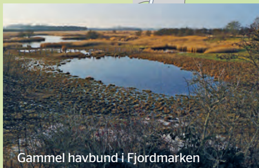
Gammel havbund i Fjordmarken